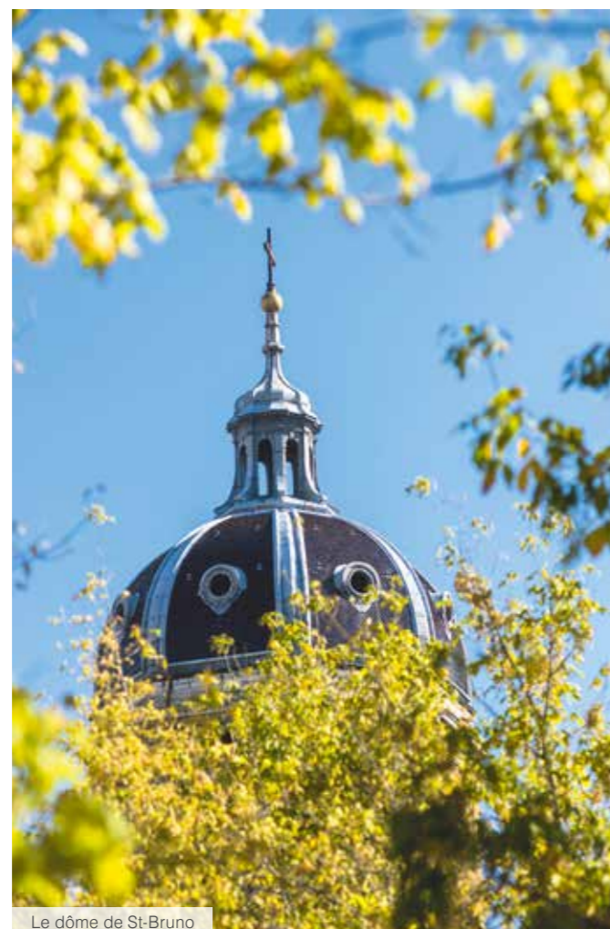
Le dôme de St-Bruno