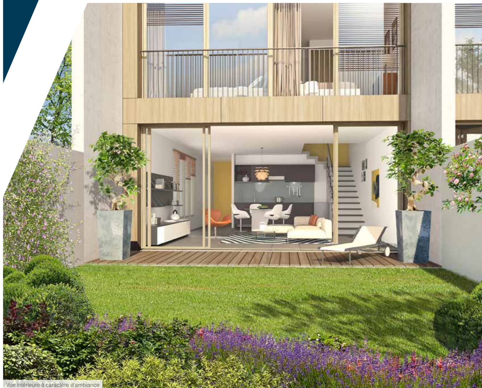
Vue intérieure à caractère d'ambiance

Pour votre sécurité, l'accès aux logements est entièrement contrôlé par vigik et vidéophone. Et pour toujours plus de sérénité, les résidents disposent d'un parking en sous-sol ou d'un garage double.