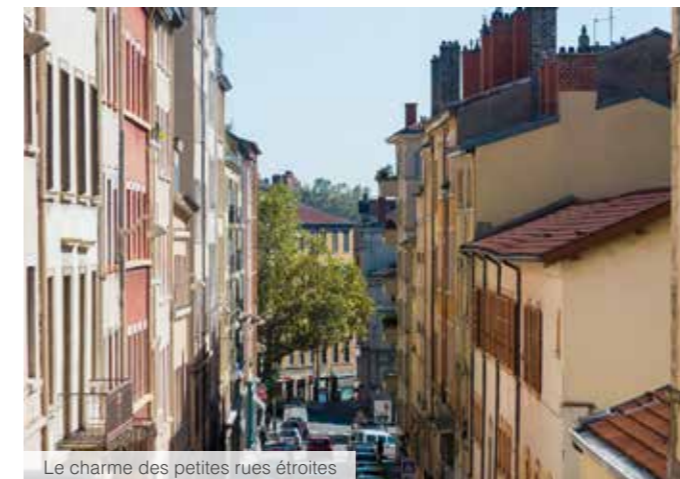
Le charme des petites rues étroites