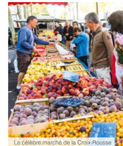
Le célèbre marché de la Croix-Rousse