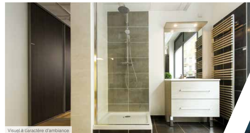
Visuel à caractère d'ambiance