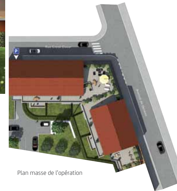
Plan masse de l'opération