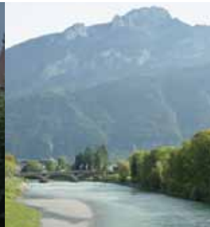
La Pointe d'Andey