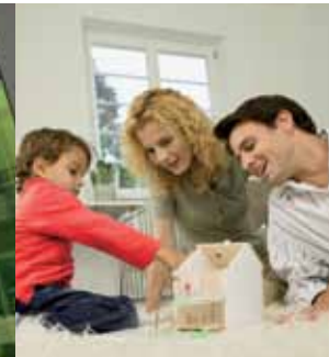
Les Quais d'Arves