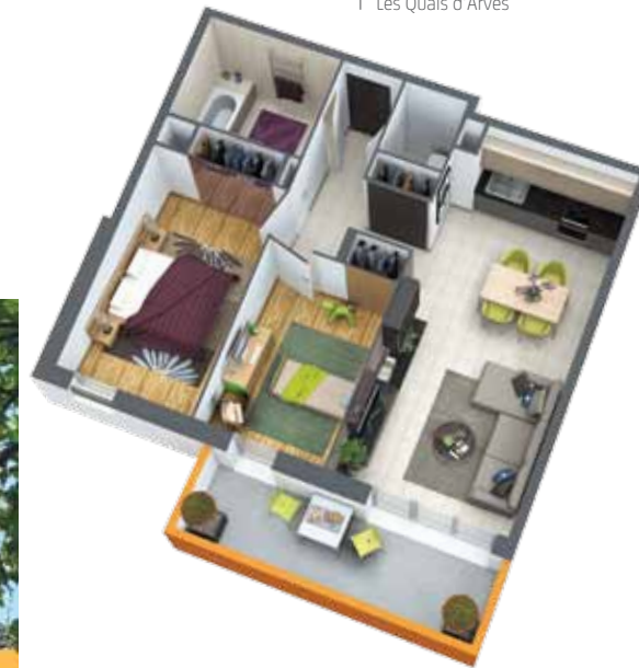
Exemple d'agencement de l'appartement 3 pièces, lot 113 de 63,24 m 2 et 9,09 m 2 de balcon.