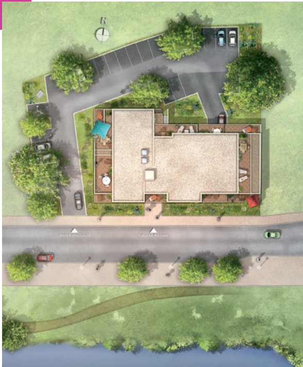
Plan d'ensemble de la résidence

Petite résidence de 4 étages plus attique, l'ensemble architectural est conçu pour préserver les espaces verts existants et créer une ambiance végétale jusqu'aux logements situés en rez-de-chaussée. Les ouvertures verticales laissent pénétrer la lumière en créant une clarté optimale.