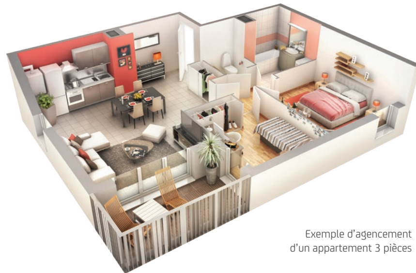
Exemple d'aménagement d'un appartement 3 pièces