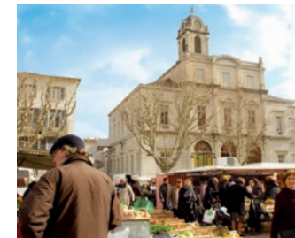
Marché place de l'Hôtel de Ville

L'eau, le végétal et .... SWAN, vous êtes les bienvenus !