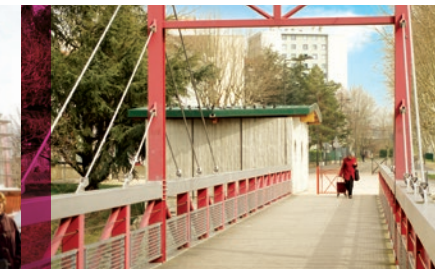
La grande passerelle