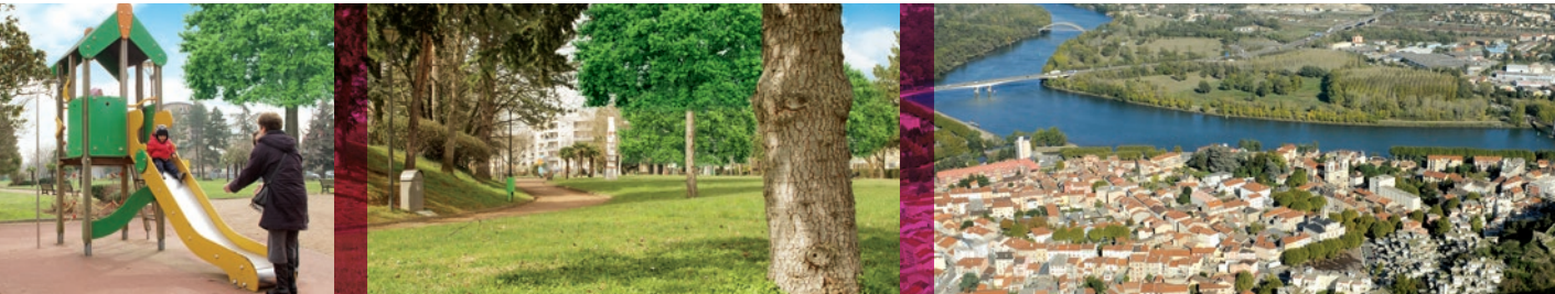
Aire de jeux - Parc de Normandie Niemen

“UN HABITAT CONTEMPORAIN FAIT DE SÉDUCTION ET D'ÉLÉGANCE !”