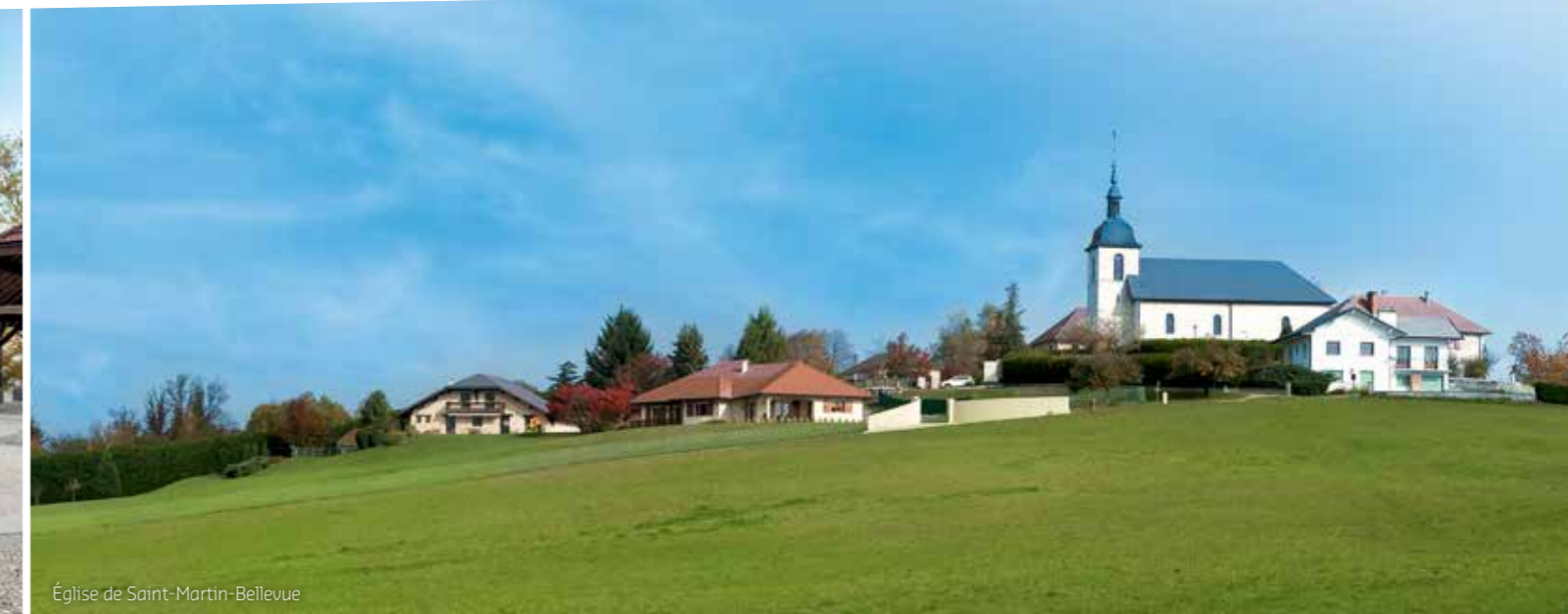
Église de Saint-Martin-Bellevue