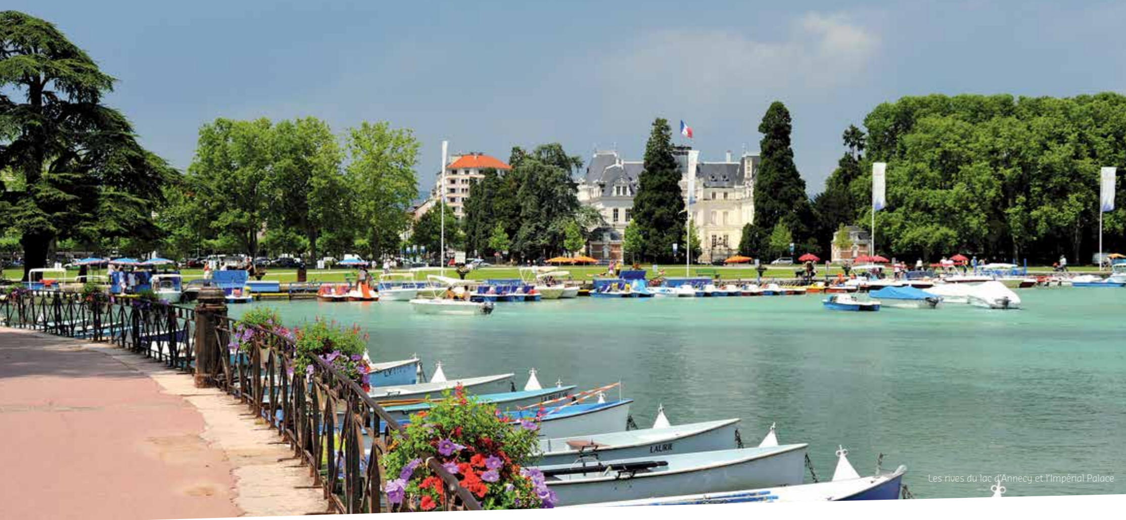
Les rives du lac d'Annecy et l'Impérial Palace

Vivre dans la région d'Annecy, l'âme montagnarde en héritage