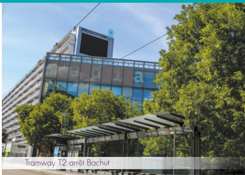
Tramway T2 arrêt Bachut