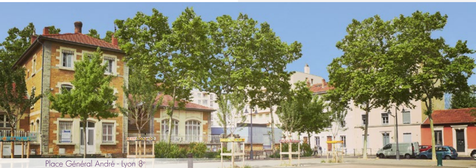
Place Général André - Lyon 8 e

Appréciez une situation privilégiée et reliée au centre-ville, où tout est accessible : sorties culturelles, festives, sportives, restaurants, terrasses ou promenades... Nombreuses sont les possibilités du 8 e arrondissement, de quoi trouver votre bonheur.