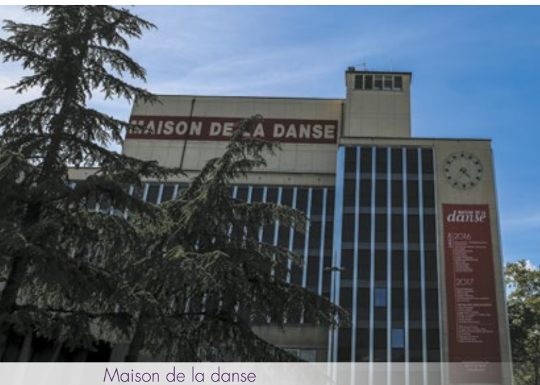
Maison de la danse