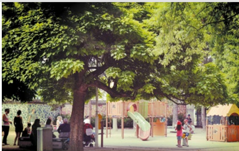
Jardin Marie Ducher

« Nous garantissons des emplacements recherchés, une valeur sûre pour votre avenir »