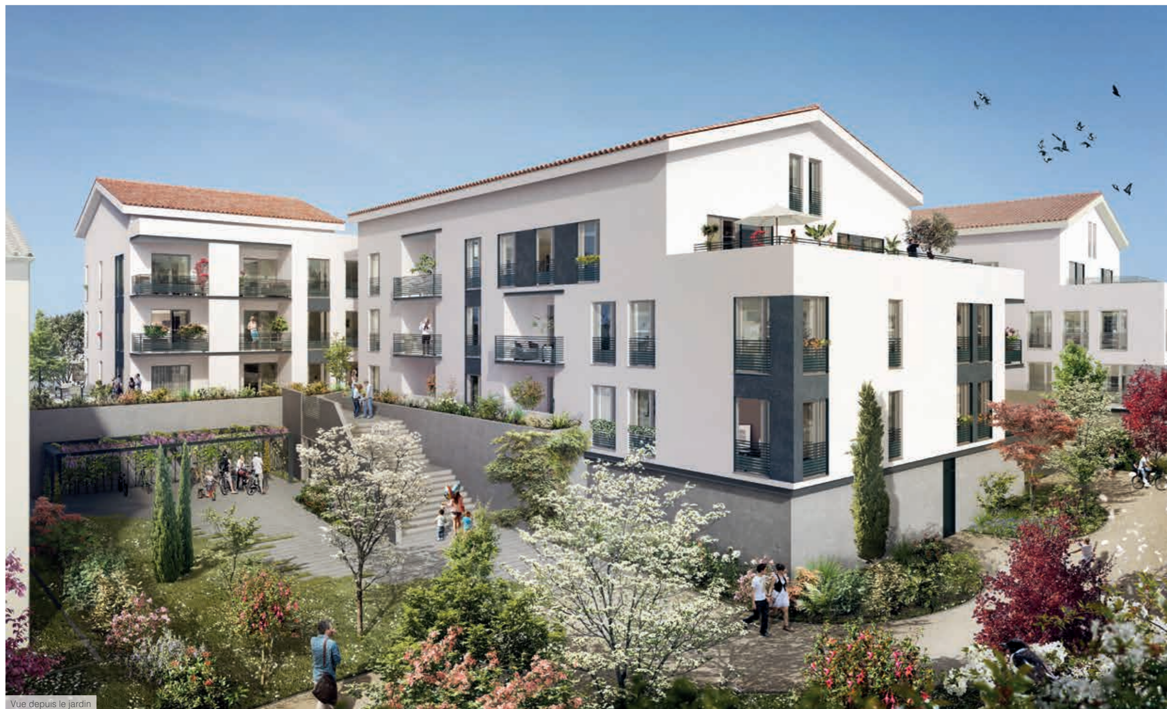
Vue depuis le jardin

La recherche de l'excellence s'est aussi attachée aux détails pratiques avec une sécurité renforcée grâce à un contrôle d'accès par portier vidéo et un accès sécurisé de l'ascenseur desservant les parkings.