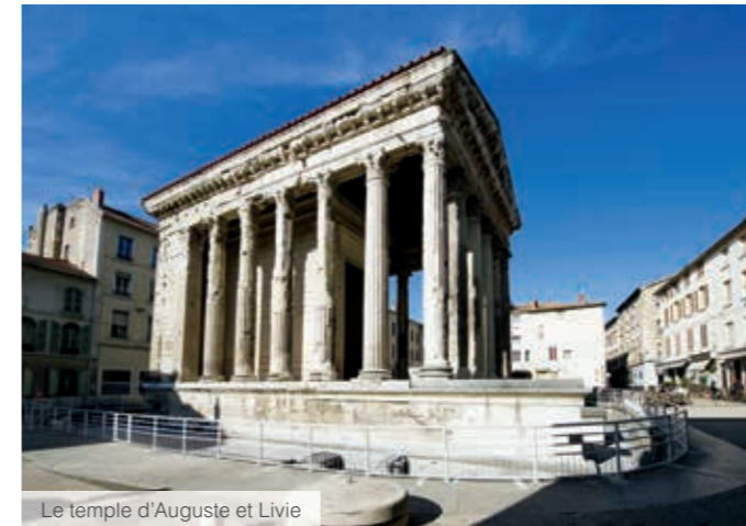
Le temple d'Auguste et Livie

Vienne n'est pourtant qu'à trente kilomètres de Lyon que l'on rejoint désormais en seulement 20 minutes** grâce au nouveau TER cadencé. Ville d'art et d'histoire, Vienne séduit par la majesté de ses vestiges romains avec son théâtre antique ou le temple d'Auguste et de Livie et de ses monuments comme la cathédrale Saint-Maurice. Elle charme aussi par la convivialité de son centre historique.