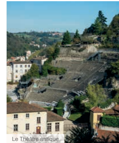
Le Théâtre antique