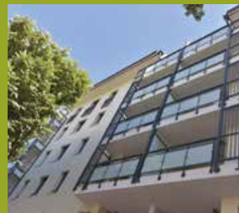
PATIO VERDE 390 Avenue du comte vert