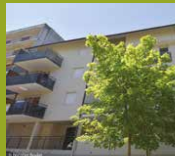
Les HAUTS DE CURIAL 156 rue Dacquín