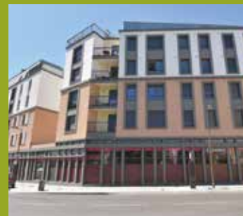
VIA CARDINALE Place d'Italie/ angle rue Victor Hugo