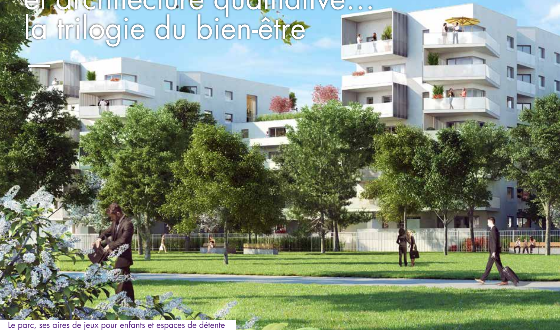
Le parc, ses aires de jeux pour enfants et espaces de détente