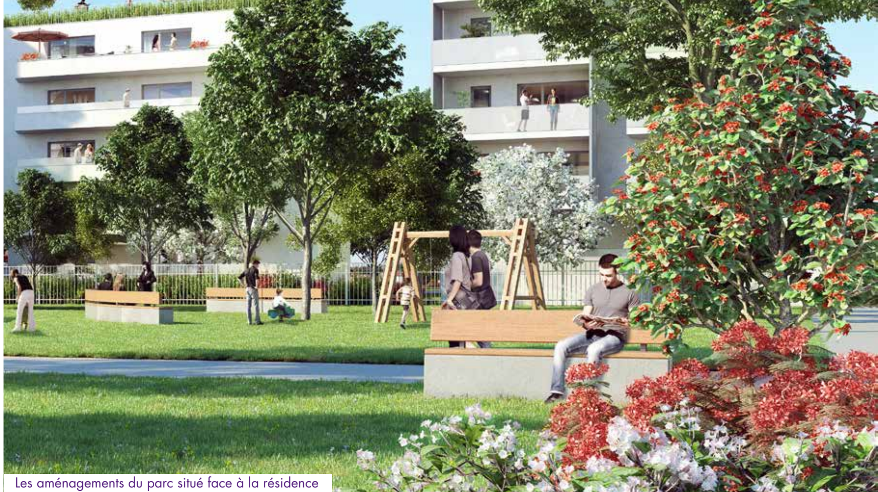
Les aménagements du parc situé face à la résidence