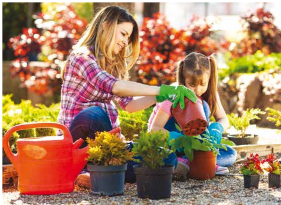
Les plaisirs du jardinage sur la terrasse partagée de la résidence

Vous découvrez un espace de jardinage et du mobilier de jardin, choisi avec goût et disposé avec soin. Il vous vient alors une idée : la prochaine fois, vous reviendrez ici partager un repas avec vos nouveaux voisins.