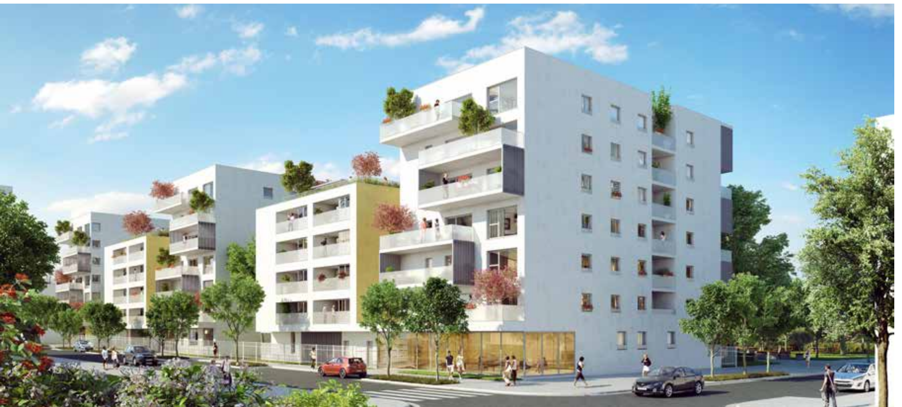
Côté rue Évidence dévoile des lignes contemporaines et sobres