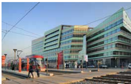
Le pôle multimodal du Carré de Soie

T ransformé. Magnifié. Villeurbanne La Soie va vous étonner. Toujours aussi accessible et proche de l'hyper centre de l'agglomération, il est devenu aujourd'hui un pôle majeur de loisirs, de commerces et d'activités économiques. Situé au cœur